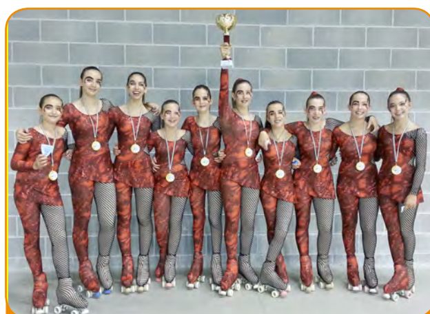
Il gruppo spettacolo "VIAGGIO SU MARTE" primo classificato