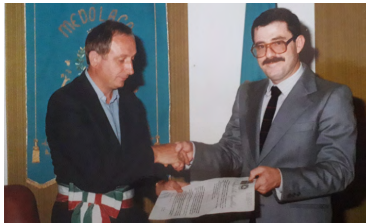
La consegna della Cittadinanza Italiana